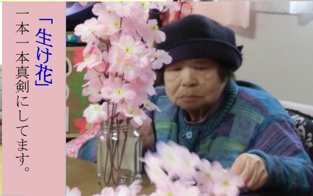
「生け花」 一本一本真剣にしています。