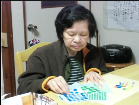
「色彩バッチリ」 どれにしようかな？

最近夕日は沈むのが遅くなってきました。 河崎に来られる方がもう帰るの？って事もあります。