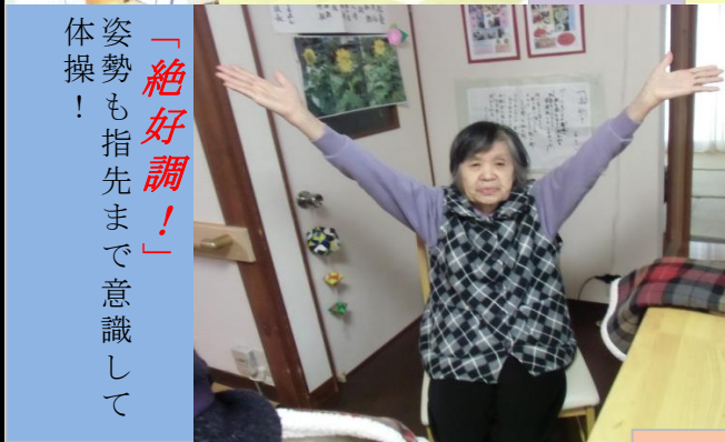
「絶対調！」 姿勢も指先まで意識して 体操！