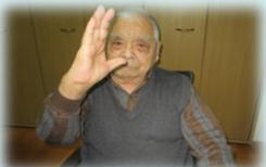
職員を見つけて気さくに声をかけて下さるUさん。「おはよう。今日も調子がいいわい。」と笑顔です。