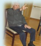
シナプソロジーに取り組むKさん。「私はチョキですよ。さあ皆さんはどうですか。」