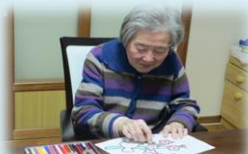
「塗り絵をしたことがないのよ。」と途惑いながらも笑顔で取り組むMさんです。