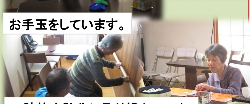
下肢筋力強化に取り組んでいます