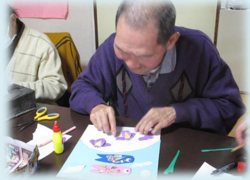
5月用の飾り作りをしました。