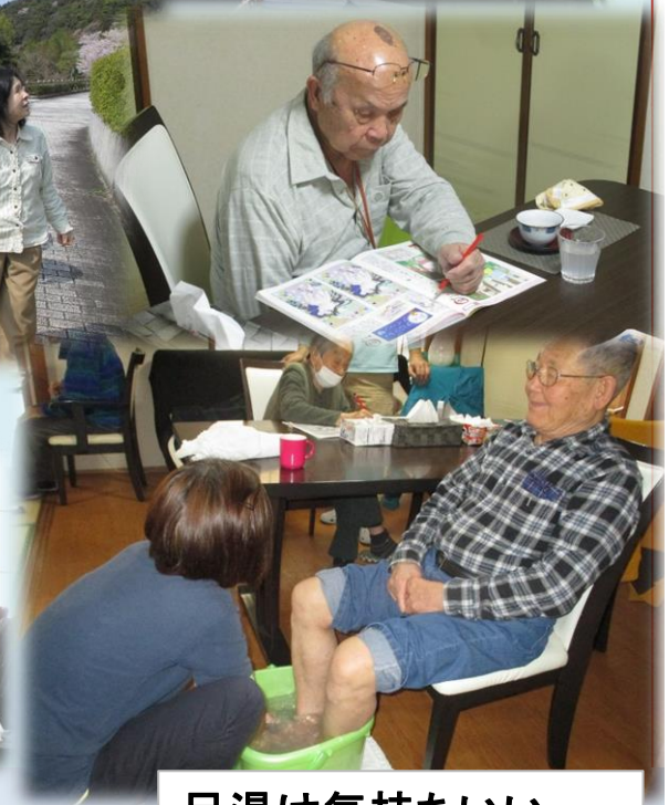
足湯は気持ちいい