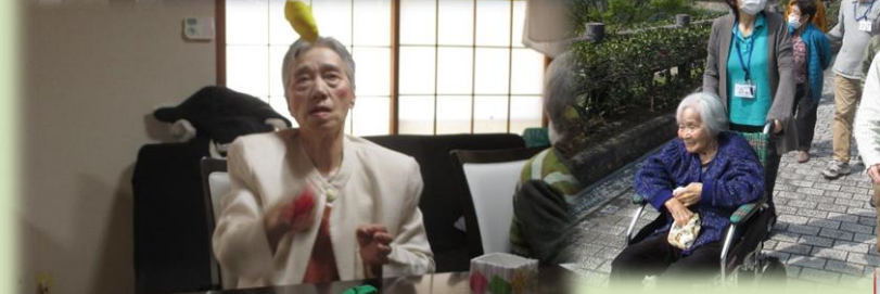
お手玉をしています。