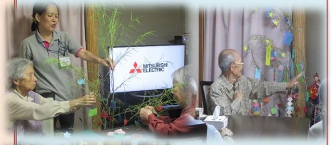
七夕飾りを作っています。

朝顔の飾りを作られました。 ワイワイと話しながら思い思いの場所に 付けておられました。