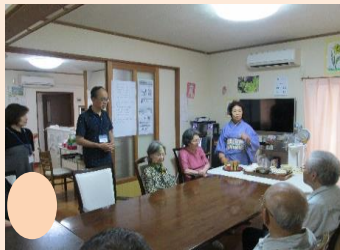
裏千家の先生のご指導により、お茶のたて方を学びました。