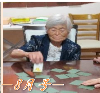
事業所人気の坊主めくりに挑戦