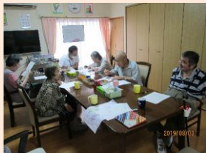
「これ何？」「それはね～」と、意見交換開始！！さー！答えはでたかな？