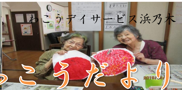
見てみて私たちの力作！！