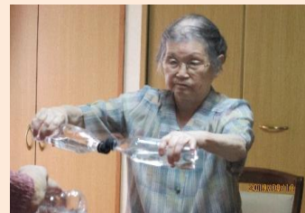
ペットボトルを持つ手が様になってます。丁寧な指導とそれをきちんと実施されてる結果ですね