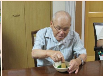
「抹茶はたてたことがないわ！これでいいですか？」と、緊張した面持ち！茶筌を持つ手に力が入ります。