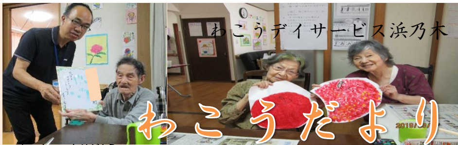
ホーホー！ありがとう