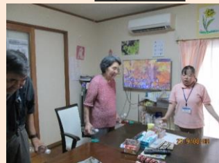
ペットボトル体操、徐々に動きが良くなり成果に繋がっています。