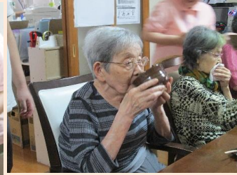
「こうやって頂くのよね。おいしいわ～！」