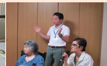
優しい歌声と懐かしい歌にみなさんの思い出がよみがえります。