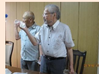
指導員の声かけや動きに合わせて集中！真剣そのものです！