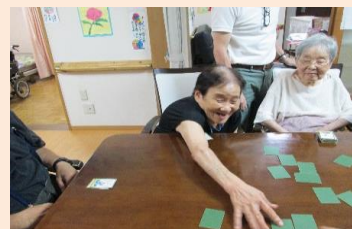
「わー坊主が出たわ！」「お姫さんがでたわー」と、今日も歓喜の音が響きます。さて勝者はどなたかな？