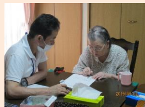
スタッフのヒントを得ながら難しい問題にも挑戦です！ファイト一発