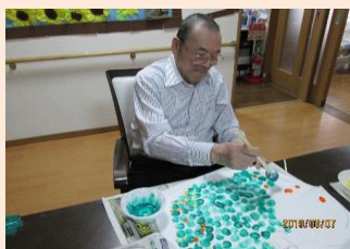
壁面用の野菜の絵にポンポンと絵の具を押しています。簡単に押せるので、ポンポン・ポンポンとアツという間にできていました。皆さんありがとうございました。