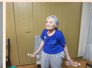
「こうですかね？」「ああ～良いですよ～！その調子！ハイ！1・2・3……