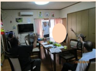
今日も頭と身体を使って、楽しい時間を過ごしましょう！