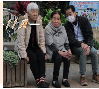
ペンギン可愛いですね！エッどこどこ？

わこうデイサービス浜乃木 〒690-0044 島根県松江市浜乃木6丁目8-3 1 TEL 0852-67-5028 FAX 0852-25-5775 HP http://www.wakoukaigo.co.jp/ 事業所登録番号： 3270103009