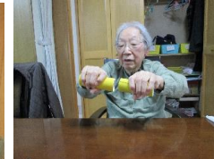
「こうかしら?」「いや!こうよね!」と、確認しながら体操の準備中かな?調子はいいいみたいです。