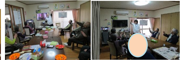
今日も大きな声がホールに響きます。脳も気分も切り替え皆さん一緒に!!! ス・パ・イ・ス・ア・ー・プ!!!