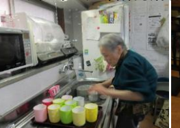
さすがです!次々とコップを洗って下さいます。オッ!懐かしい遊びをしていますね!「こうやって、こうって、次はあなたよ」「ハイ!昔は3個でするよったけどね〜、ほい!ホイのホイ」・「私は字を書いていると落ち着くわ」・ 天気の良い日に男性方は公園の散歩です。それぞれに日々楽しんでおられます。