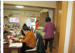
いつも手際良く布団カバーの交換をして下さったり、クローゼットに運んで下さいます。