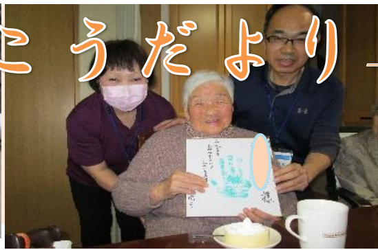
お誕生日おめでとうございます！いつまでも素敵な笑顔を見せてくださいね 機能訓練・体操