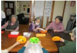
賑やかな音楽とともに白熱する物送りゲーム。ああじゃ、こうじゃと言葉も飛び交います。