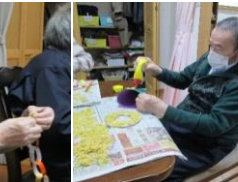
クリスマス会に向けての準備に追われる皆さん。「輪っかは何とどれくらい作るの?」「まだまだじゃないの?」「マカロニでこんなもんがつくれるんだ〜」作りだしたら止まらない様子。皆さんご協力ありがとうございます。