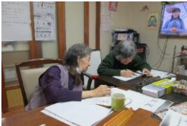
「これどういう事?」「これはね〜」...「あら?わからんわ!」はっはっはっは、笑い声 レクリエーション