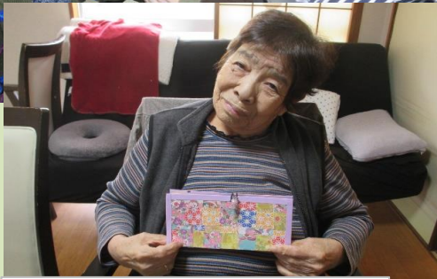
物作りで完成しました。