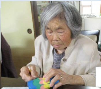
アクティビティに取り組まれています。