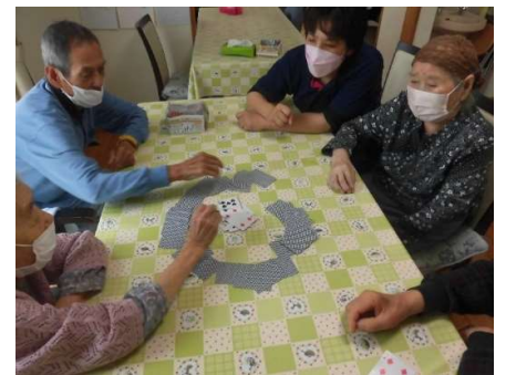
レクリエーションの様子です。男女問わず一緒に楽しめる内容をたくさん用意しています!