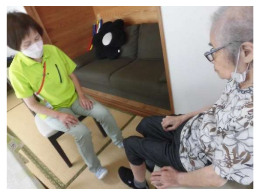
個別での運動の様子です。集団体操とは別に、15~20分ほどマンツーマンでの運動を行います。

今年は例年より早く梅雨が明けて、毎日暑い日が続いています。またコロナウイルスも再度の感染拡大しているのに加えて、熱中症のリスクも高まっていますので、感染対策だけではなく、こまめな水分の提供・室温や湿度、衣類の調整にも配慮してまいります。