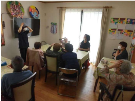
脳活性化プログラム(シナプソロジー)で しっかりと頭を働かせます!